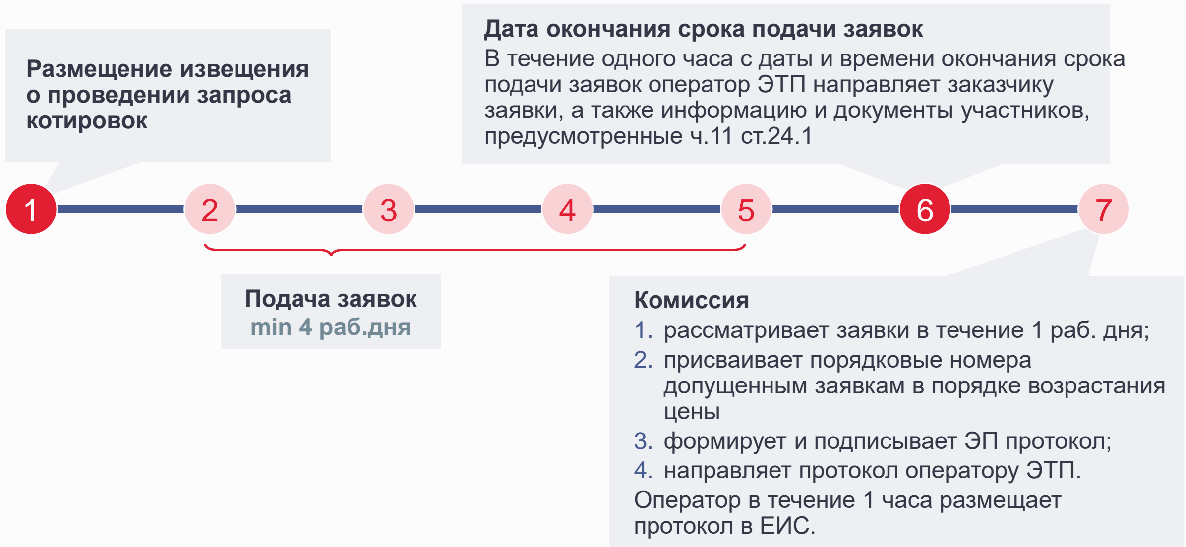
СХЕМА ПРОВЕДЕНИЯ ЗАПРОСА КОТИРОВОК В ЭЛЕКТРОННОЙ ФОРМЕ