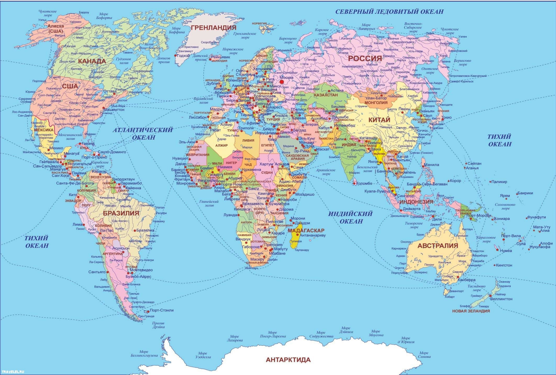
Обыденное представление о странах мира